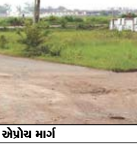
ભિસ્માર એપ્રોચ માર્ગ

દેલાડવા ગામથી સુરત જવા માટેનાં ટુંકા અંતરનાં માર્ગની જિલ્લા પંચાયત માર્ગ-મકાન વિભાગ મરામત ન કરતાં ગામલોકોએ ઘણી હાલાકી ભોગવવી પડે છે. આ એપ્રોચ માર્ગ પર આવેલ ગરનાળાનું રિપેરિંગ ન થતાં માર્ગ ડેમેજ થઈ રહ્યો છે. પરંતુ નફકટ