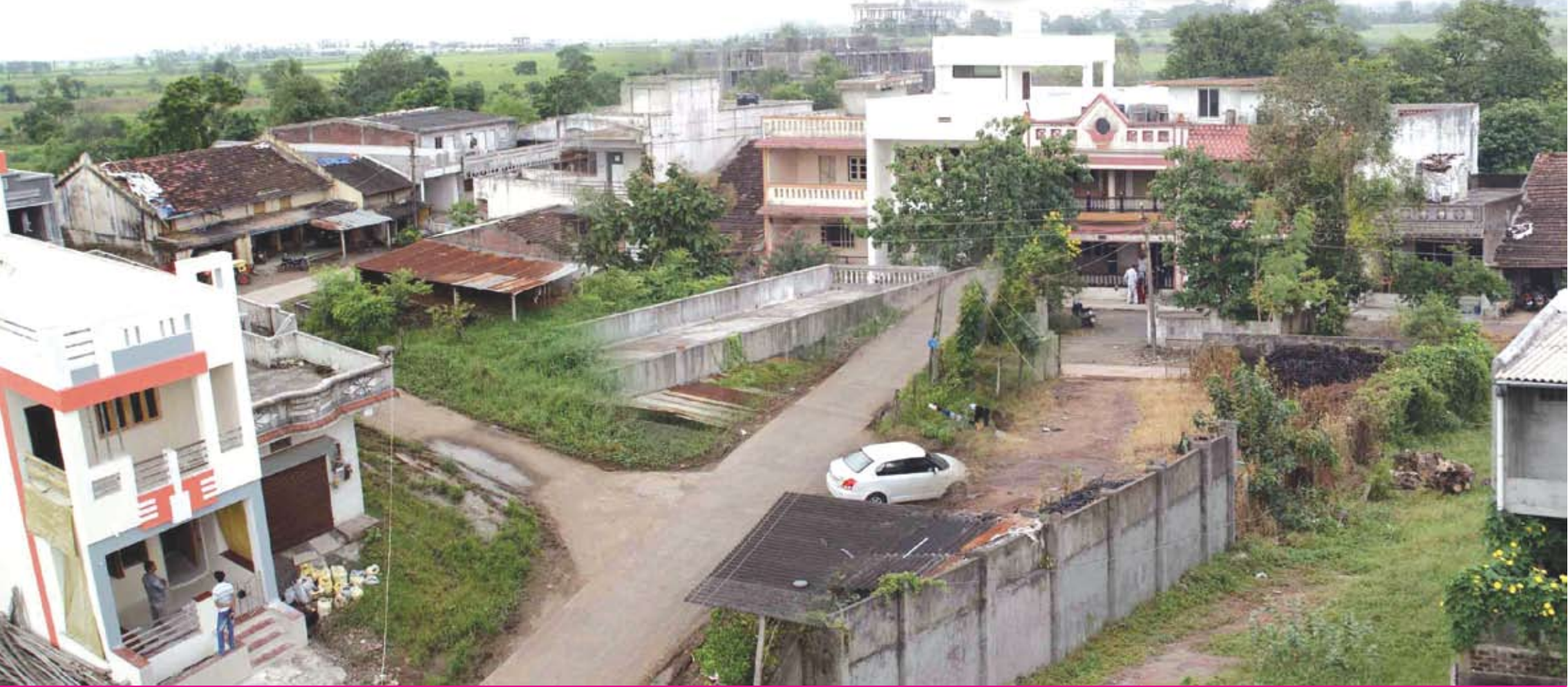
ચોર્યાસી તાલુકાનું દેલાડવા ગામ ભવ્ય ભૂતકાળ ધરાવતું ગામ છે. મૂળ ગામનું નામ દેવરાજપુર હતું. વસ્તી વધતા હાલનાં સ્થળે સને ૧૮૫૬માં વસવાટ કર્યો અને દેવરાજપુરનું નામ બદલી દેલાડવા ગામ પડ્યું હતું. અસ્સલ બ્રિટિશ શાસનના સમયે દેસાઈઓને દેસાઈગીરી પણ મળી હતી. ગામનાં જે અનાવિલો ઉચ્ચ હોદ્દાઓ ઉપર પણ ફરજ બજાવી ચૂક્યા છે. તો ઘણાં મોટા ધંધામાં પણ જોડાયા છે. આ દેલાડવા ગામ સુવિધાથી વંચિત હોવા છતાં વિકાસ માટે મથામણ કરતું જોવા મળે છે.

સુરત મહાનગરપાલિકા વિસ્તારને અડોઅડ આવેલ ચોર્યાસી તાલુકાનું દેલાડવા ગામ ભૂતકાળમાં ભવ્ય વારસો