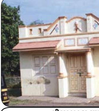
મીઠાકાકા સત્યાગ્રહ સ્મૃતિ મંદિર

આઝાદીની લડતમાં જલાલપોર તાલુકાનાં બોદાલી ગામનાં યુવાનોએ પણ ભાગ ભજવ્યો હતો. બોદાલી ગામ પણ સ્વાતંત્ર્ય સેનાનીઓનું ગામ બન્યું હતું. જયારે બોદાલી ગામ મહાત્મા ગાંધીજીએ 'ખજૂરી કાપો' આંદોલન શરૂ કરાવ્યું હતું. સને ૧૯૩૦માં ૨૩મી એપ્રિલે મહાત્મા ગાંધીજી બોદાલી પધાર્યા હતાં. ગાંધીજીએ ગામમાં ભાષણ કર્યો બાદ બોદાલીની સીમમાં આવેલ ખજૂરીનાં ઝાડ પર કુહાડીનો ઘા કરી ખજૂરી કાપો આંદોલન શરૂ કરાવ્યું હતું. પૂ. ગાંધીજીએ કરાડીની પહોંકુટિરમાં બેસી વાઈસરોયને પત્ર લખી જણાવેલું કે હવે હું ધરાસણાનાં