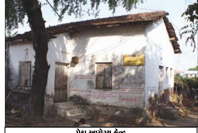
પેટા આરોગ્ય કેન્દ્ર

ગામના સીમાડામાંથી પસાર થતી પૂર્ણા હળપતિ, માલાવંશી, પરમાર, મિસ્ત્રી, મૈસૂરીયા, દરજી, બ્રાહ્મણ તથા ગાંધી લોકોનો વસવાટ છે. ગામનો