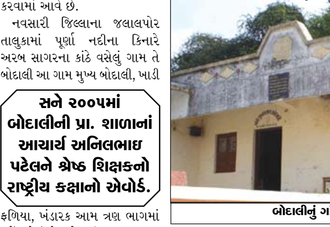
બોદાલીનું ગાંધી પુસ્તકાલય

સુવિધા સાથે શરૂ કરાઈ છે. શાળામાં લાયબ્રેરી વિજ્ઞાનખંડ બનાવવામાં આવ્યો છે. તો ધો. ૧ થી ૮નાં ભાળકો માટે બેંચની વ્યવસ્થા કરવામાં આવી છે. જ્યારે આખા વર્ષ દરમિયાન ત્રીસ દિવસ દાતાઓનાં સહયોગથી તિથિઓજન આપવામાં આવે છે. દાતાઓનાં સહયોગથી દરેક બાળકને કામી ધોરણે એક ગણવેશ તથા દરેક બાળકને વિષયવાર નોટબુકનું વિતરણ કરવામાં આવે છે. નવસારી જિલ્લાના જલાલપોર તાલુકામાં પૂર્ણા નદીના કિનારે અરબ સાગરના કાંઠે વસેલું ગામ તે બોદાલી આ ગામ મુખ્ય બોદાલી, ખાડી