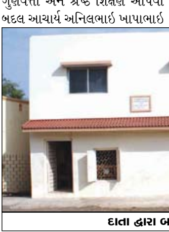
નવસારી જિલ્લામાં બોદાલીની જિલ્લા પંચાયત સંચાલિત પ્રાથમિક નમૂનારૂપ છે. દાતાઓનાં સહયોગથી ઇન્ટરનેટ સુવિધા સાથે વાતાનુકુલિત કોમ્પ્યુટર લેબ